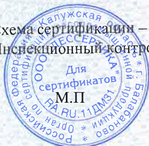
Схема сертификации – 3с. Инспекционный контроль – декабрь 2021 года, декабрь 2022 года.